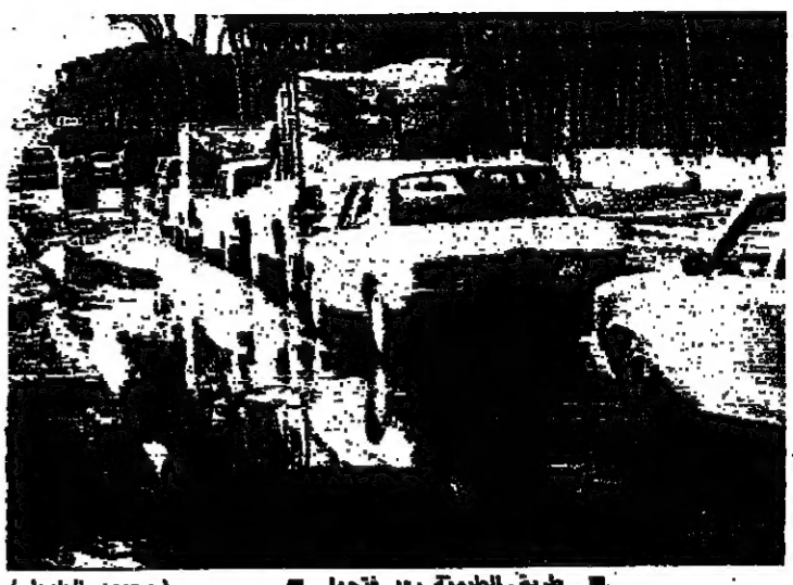
إزالة العوائق من على طريق المتحف

في الوقت الذي نجحت فيه الجهود التي بذلت على غير صعيد، في فتح كل معابر العاصمة، وصلت خطة الساحل إلى طريق مسدود. فطلقت لجنة الطوارئ المشتركة لاقليم الخروب، بعدما فشلت في التوصل إلى تصور موحد لدور قوى الأمن، والنقاط التي يقترض أن تتمركز فيها، في بعض قرى الاقليم، تصديداً لانتشار الجيش اللبناني على الطريق الساحلي من خلد إلى الأولى. (التفاصيل على الصفحة ٤) وقد طرحت قوى الأمن الداخلي حلاً وسطاً بين رفض الحزب التقدمي الاشتراكي إقامة نقاط ثابتة، وأصرار قوات الليتانية على إقامة مثل هذه النقاط، لطماننة سكان قرى الخروب، وفي وجود توترات متزايدة بين هذه القوى، ولا سيما بين